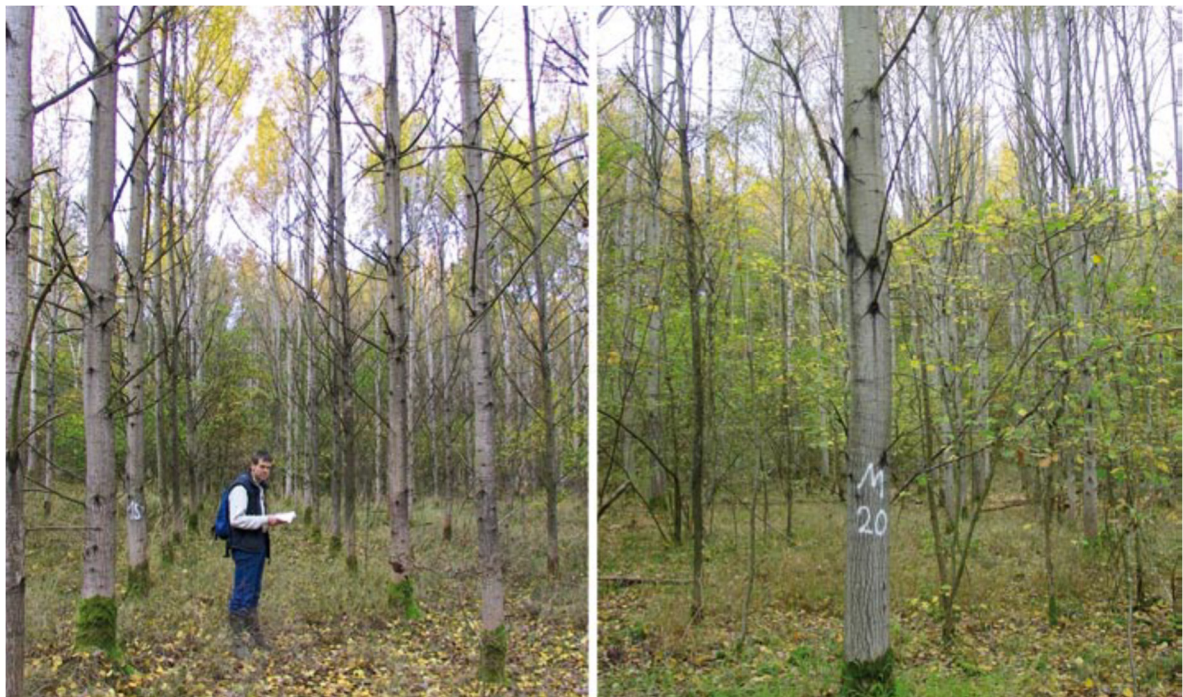
Abb. 2: Habitus zulassungsfähiger Aspen ( Populus tremula ) im Alter 24 Jahre (links) und Habitus einer gleichaltrigen Hybridaspen ( P. tremula x P. tremuloides ; rechts) jeweils auf der Fläche Gießen (Gebhardt et al. 2012)